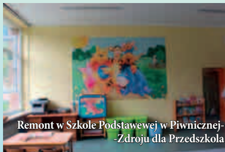
Remont w Szkole Podstawowej w Piwnicznej-Zdroju dla Przedszkola