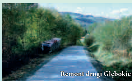
Remont drogi Głębokie