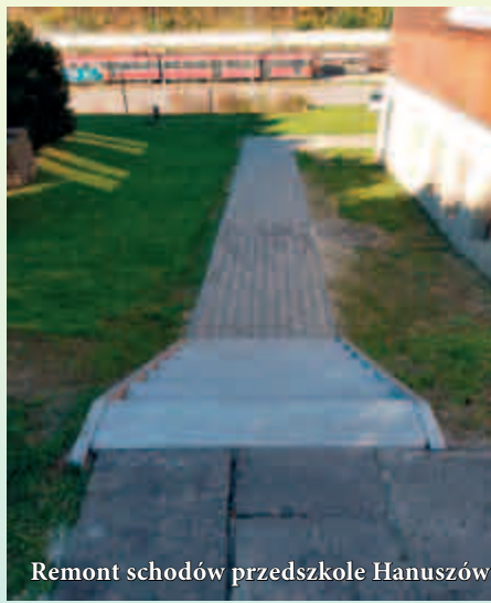
Remont schodów przedszkole Hanuszów