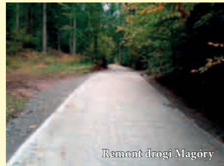
Remont drogi Magóry