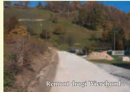
Remont drogi Wierchomla