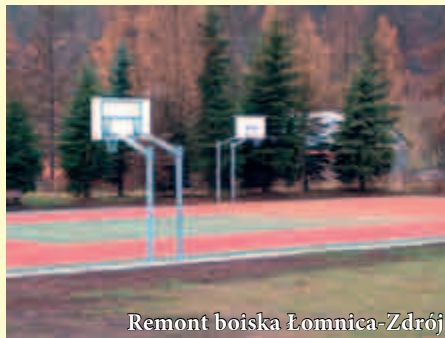
Remont boiska Łomnica-Zdrój