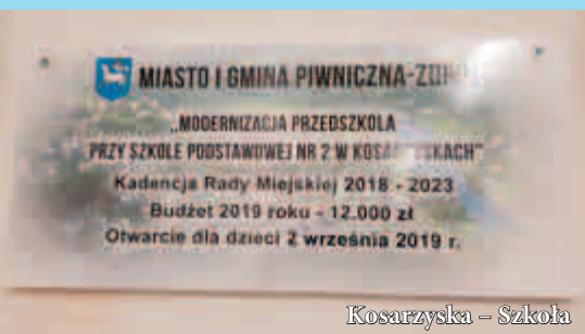
Kosarzyska – Szkoła