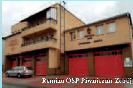
Remiza OSP Piwniczna-Zdrój