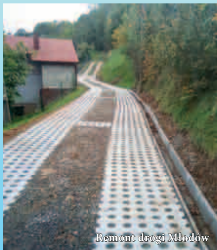
Remont drogi Młodów